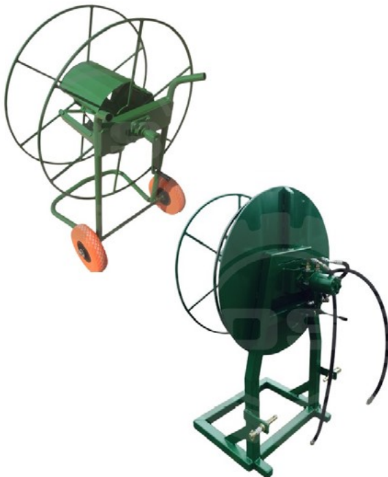
Enrolladores de manguera o cinta de riego diseñados para labores agrícolas