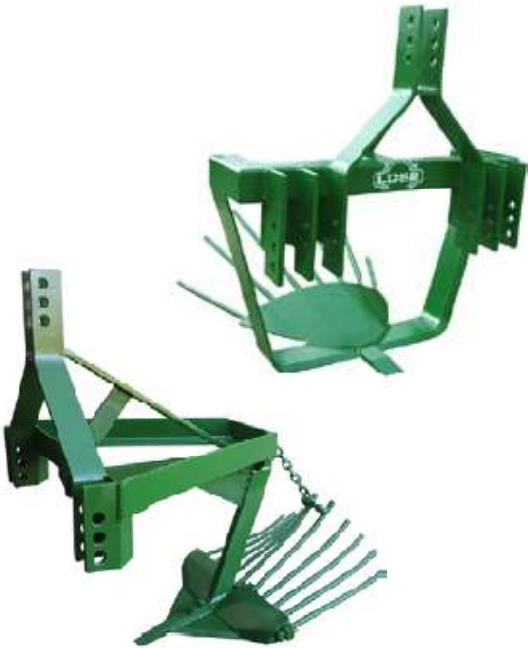
ARADO ARRANCADOR PATATAS